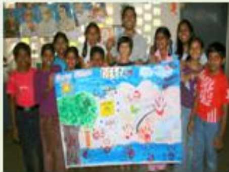
Activity Based Learning