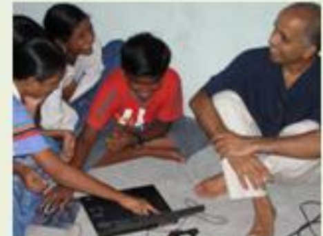
Make Learning Fun