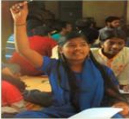
Make Children Curious / Ask Questions